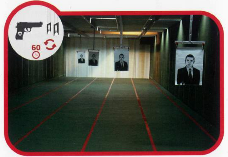
Silahlı Yenileme Eğitimi 60 Saat