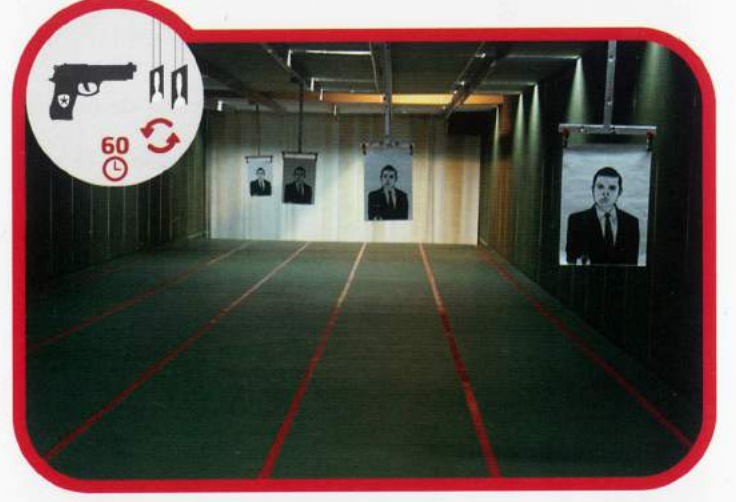
Silahlı Yenileme Eğitimi 60 Saat