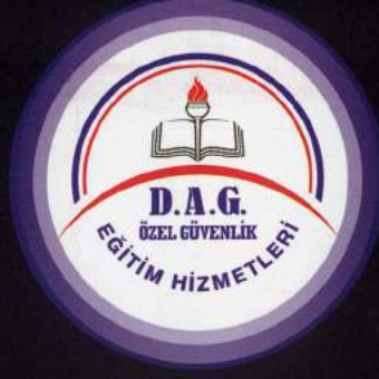
DAG Eğitim Hizmetleri