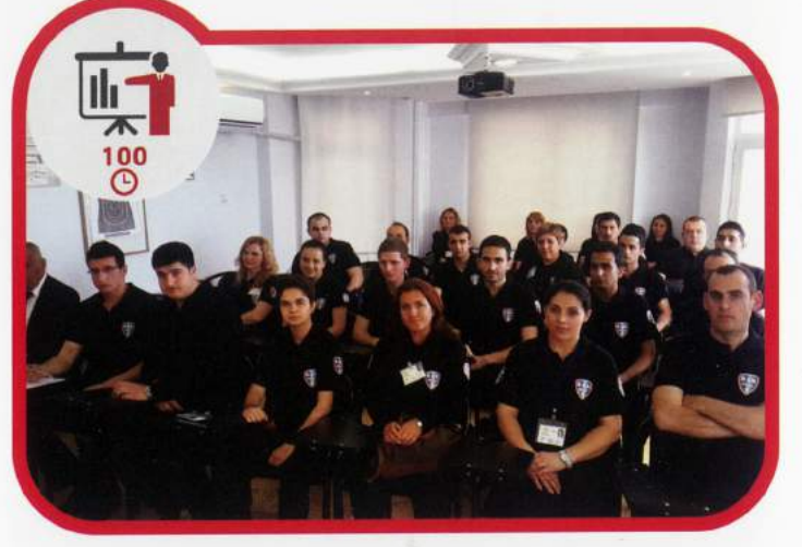
Silahsız Temel Eğitim 100 Saat