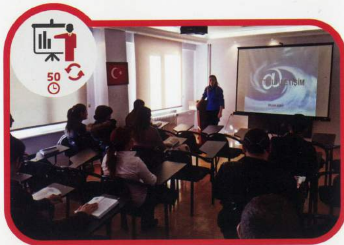
Silahsız Yenileme Eğitimi 50 Saat