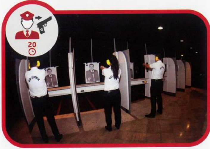
Silahlıya Geçiş Eğitimi