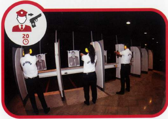
Silahlıya Geçiş Eğitimi