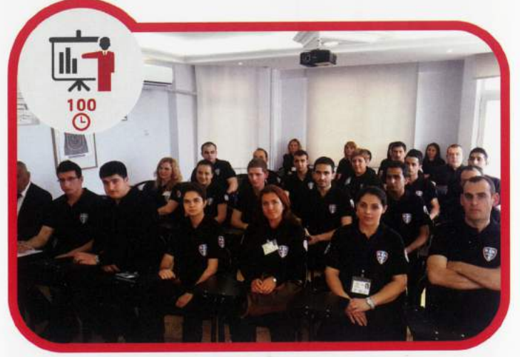
Silahsız Temel Eğitim 100 Saat