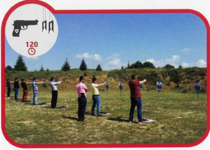
Silahlı Temel Eğitim 120 Saat