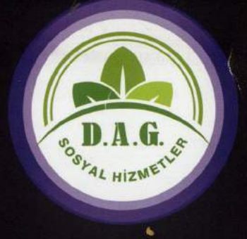
DAG Sosyal Hizmetler