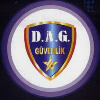
DAG Güvenlik Hizmetleri